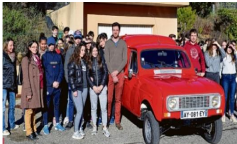
Aide au financement 4 L Trophy