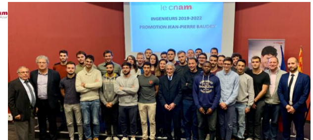
Parrainage de promotion