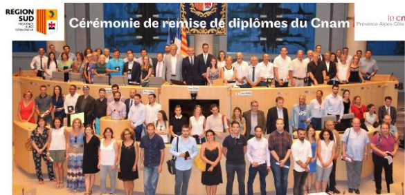
Remise des diplômes